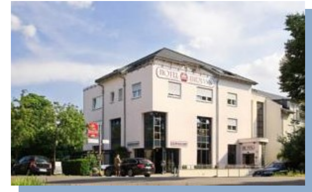
Hotel Hiemann Delitzscher Landstraße 75 04158 Leipzig-Wiederitzsch